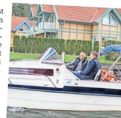
Warum nicht mal die Welt vom Wasser aus erkunden?

Die Seenlandschaft ist ein Pfund, mit dem im Ruppiner Land gewuchert werden kann. Vielfältig lässt sich das blaue Nass erobern – etwa mit Boat City von seinen zwei Standorten in Neuruppin und im Rheinsberger Hafendorf aus. Die Experten führen auf der Rheinsberger Seenkette durch klare Seen des Zechliner Landes, zum lauschigen Kagar-Bach und über den quirligen Rhin. Ganz dem Kräfteaufwand des Ausflüglers bleibt es überlassen, wie die Natur erfahren wird. Zur Verfügung stehen für den Aktiven Kajak und Kanu oder für den PS-Begeisterten Motorboote. Boat City hat sich auf Boote ohne Sportbootführerschein spezialisiert. Nach einer kurzen Einweisung des Hafenmeisters kann zum Beispiel vom Neuruppiner Jachthafen gestartet werden. In der Region hat der Einsteiger für seine Fahrversu-