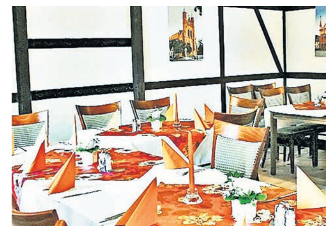
In Blum's Hotel in Kyritz kann man nicht nur im Sommer entspannen und genießen.

Blum's Hotel Maxim-Gorkis-Straße 34 16866 Kyritz www.bluhms-hotel.de