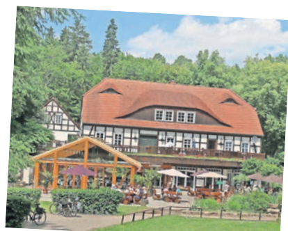
Im Solebad und in der Sauna kann man bei unbeständigen Wetter entspannen.

Bereits Theodor Fontane schwärmte von der Ruppiner Schweiz: „Wer will sagen, wenn er die Ruppiner Schweiz durchwandert, wo ihr Zauber am mächtigsten wirkt? Ist's Boltenmühl?“ Eines der beliebtesten Ausflugsziele liegt idyllisch am Wald direkt am Tornowsee. Zu Fuß als Wanderer vom Kalksee in Binenwalde aus, mit dem Fahrrad durchs Grün der Wälder oder als Reisender auf dem Wasser – mit vielfältigen Möglichkeiten ist das Restaurant und Hotel Boltenmühle zu erreichen. Erholung bietet der Ort Ausflüglern und länger Entspannung Suchenden. Den Gaumen verwöhnt märkische Küche. Auf der Sonnenterrasse