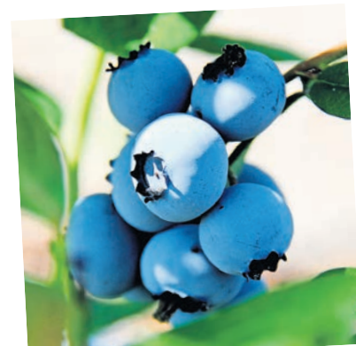
Bald ist auf dem Spargelhof in Kremmen Heidelbeerzeit.

am 16. Juli, sowie am 6. und 27. August gibt es zudem das Kasperfrühstück.