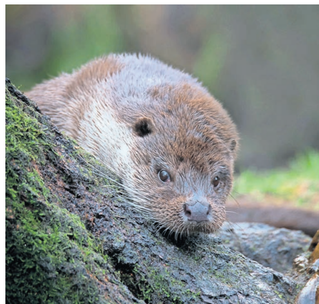
Aug in Aug mit dem Fischotter