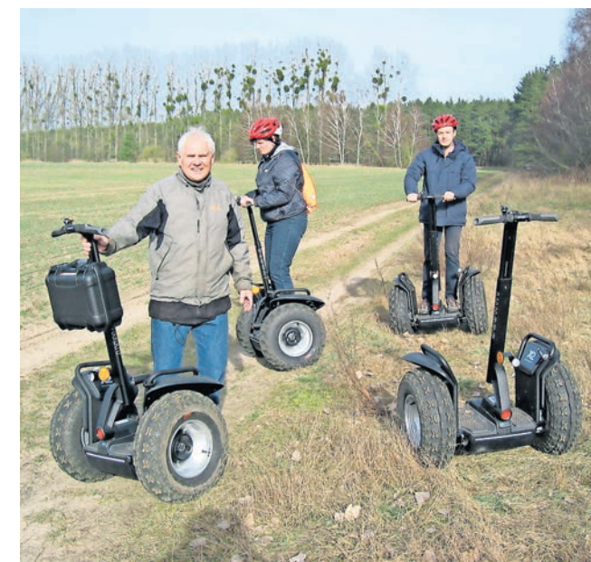
Mit Segway lässt sich die Natur auf eine ganz neue Art erkunden.