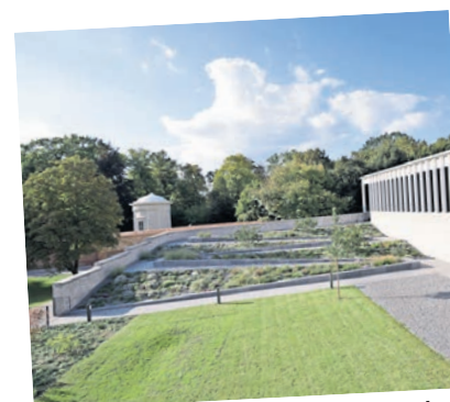
Das Museum Neuruppin wurde saniert und erweitert.

Saniert und um einen Anbau erweitert, präsentiert das Museum Neuruppin seit 2015 eine neu konzipierte Dauerausstellung. Sie zeigt sowohl die Ur- und Frühgeschichte im Ruppiner Land als auch die Stadtgeschichte Neuruppins. Die einzigartige Bilderbogen-